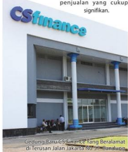
Gedung Baru CS Finance yang Beralamat di Terusan Jalan Jakarta No 57 Bandung

Dalam hal keunggulan pelayanan proses kredit, CSF telah mampu mengimbangi dengan pembiayaan lainnya. Yakin dengan persyaratan mudah, proses approval one day service , berikut ditunjang dengan SDM yang secara relationship mengalami cukup kedekatan. Tentunya, CSF optimis akan mengalami growth penjualan yang cukup signifikan.