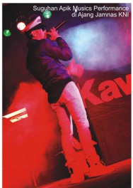
Suguhan Apik Musics Performance di Ajang Jamnas KNI

kedepan pun harus selalu terus diadakan.