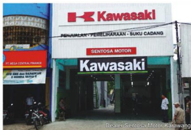
Dealer Sentosa Motor Karawang

Jika bicara mengenai penjualan motor di Dealer Sentosa Motor, yang telah memiliki lima Cabang di wilayah Karawang dan satu cabang di