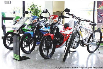
Program Punch Athlete Siap Support Penjualan

Improvement torehan angka penjualan akhir semester awal 2012 ini, jelas menjadi realisasi komitmen yang dipertahankan oleh semua pihak dalam hal perolehan volume penjualan. Lantas, apakah Kawasaki perlu berbangga diri? Atau kah semakin semangat memperkuat kembali, lini ujung tombaknya, berikut mengasah dan meramu serentetan peluru program, yang mampu memboomingkan image motor Kawasaki itu sendiri.