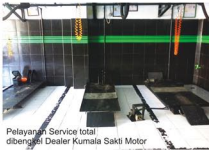
Pelayanan Service total dibengkel Dealer Kumala Sakti Motor

produk Kawasaki, tentunya Dealer ini pun selalu berusaha menjalin kedekatan dengan para customers dan komunitas/klub motor Kawasaki yang ada di sukabumi. Alhasil , keunggulan pelayanan dan kesiapan karyawan pun mampu menjalin relasi keakraban secara profesional antara satu sama lain.