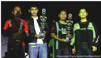
Penyerahan Trophy Kontes Modifikasi Motor

Berbagai Spontaneous Games dan penyerahan trophy berhadiah cash money , bagi para peserta lomba modifikasi pun sukses dilakukan. Di penghujung malam, suasana dingin menjadi berubah hangat di saat beberapa sexy dancer melakukan atraksi dance , yang mampu memukau rataan pasang mata yang mengahdirinya. Well, see you in next Jamnas event....!!