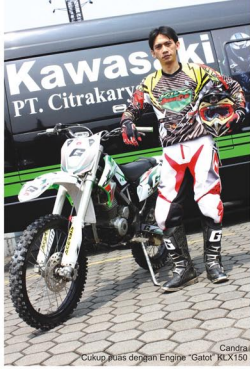
Candra Cukup Buas dengan Engine 'Gatot' KLX150

"Gatot memang cukup gesit saat melahap track yang bumpy dan berlubang. Selain ground clearance si Gatot agak