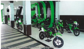
Line up berbagai motor Kawasaki yang Dipajang

P rogresifitas bisnis motor memang tak hanya berkisar mengenai achievement dan profitabilitas saja, melainkan proses jatuh bangunnya dan keberhasilan bisnis motor, didasari dari segala kesiapan, perhitungan matang, dan manajemen yang seimbang dalam mengembangkannya.