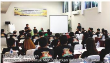
Tim Sales dan Marketing yang bersemangat untuk Meningkatkan Volume Penjualan

adanya policy yang muka penjualan motor dari bebas menjadi terikat dengan uang muka minimal 25 %. Bagi kawasaki efeknya tidak lebih berat dibanding beberapa merek lain, oleh karena itu tak menjadi masalah dan bukan sebagai hambatan, melainkan menjadi semangat dan kesempatan dalam meningkatkan volume penjualan. Nah, dengan semangat bekerja keras, secara cerdas, ikhlas dan tuntas, tentunya effort yang dilahirkan pun akan menjadi lebih luar biasa bukan!!