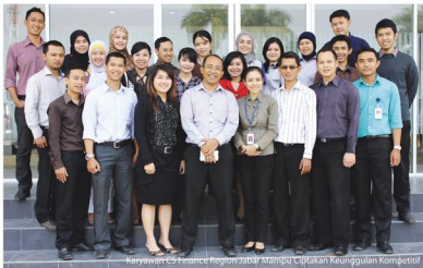
Karyawan CS Finance Regional Jabar Mengikuti Sesi Kajian Keunggulan Kompetitif

Dengan keyakinan dan landasan main goal untuk menjadi lembaga pembiayaan utama dalam industri pembiayaan kendaraan roda dua, Central Santosa Finance (CSF) yang berdiri pada tahun 2010 lalu, secara improvement memang memiliki value added untuk menjadi pemain kuat di bidangnya.