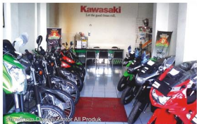
Penjualan Dealer Resmi All Produk