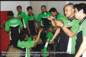
Mekanik peserta saat melakukan uji dan cara pengukuran dengan menggunakan banalki yang sesuai.

"Kegiatan training tersebut, intinya lebih diarahkan pada pemerataan kemampuan seluruh mekanik Kawasaki, khususnya bongkar pasang engine pada Ninja 250 dan kesiapan para mekanik dalam melakukan solusi terhadap trouble shooting enginnya itu sendiri". Terang Toto Susilo, Head of Service PT.CKP.