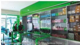
Kelengkapan Unit Spare Parts di Dealer Sentosa Motor

terkenal dengan sebutan Jalan Niaga, seiring berjalannya waktu mengenai penjualan unit yang sudah terlihat membaik, akhirnya di tahun 2008 kami mengontrak kembali Toko di Jalan Tuparev guna menunjang