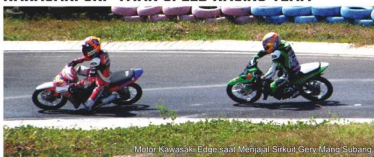
Motor Kawasaki Edge saat Menjajal Sirkuit Gery Mang Subang

yang harus perlu dibenahi, di evaluasi dan dipersiapkan.