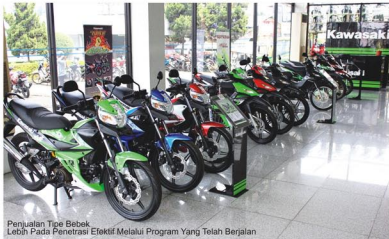
Penjualan Tipe Bebek Lebih Pada Penetrasi Efektif Melalui Program Yang Telah Berjalan

Alih-alih, mengenai kontribusi di tipe bebek sendiri, yang memang dirasa masih cukup kurang. Tentunya, antipati pertama yang dilakukan lebih pada penetrasi secara efektif terhadap program yang sudah berjalan. "Jadi dengan berbagai macam promo hadiah, berikut mengacu policy DP yang diatur sekarang ini, jelas bebek Kawasaki memang dirasa lebih rendah dibanding merk lain. Oleh karenanya optimisme dan spirit dalam mendorong volume pun terus kami gencarkan", tutup wanita yang kesehariannya bersahaja itu.