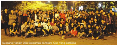
Suasana Hangat Dan Solidaritas di Antara Klub Yang Berbeda