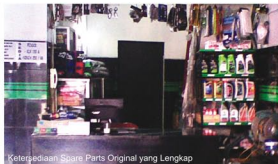
Ketersediaan Spare Parts Original yang Lengkap

Berawal dari image produk Kawasaki yang diyakini memiliki kualitas produk sangat baik, berikut menyandang peluang bisnis dan usulan yang lebih memiliki progress profitable . Tepatnya pada tanggal 20 Juli 2005 silam, Dealer Kumala Sakti Motor pun resmi berdiri menjadi dealer Kawasaki di Kota Sukabumi.