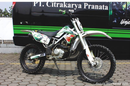
Regular Style but still stylish

lebih tinggi, ubahan pada bagian roda dan kaki-kakinya ini memang lebih dimaksudkan agar ia mampu menjangkau berbagai medan. Baik saat berakselerasi di medan terjal, ataupun saat troli/dibagian roda yang mampu menempel track tanah dengan sangat kuat", ucap Pria perintis klub motor KOC dan penghobi adventure tersebut.