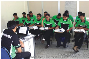
Siswa dan Pengajar Mekanik Pusat Teknik Peningkatan Keterampilan dan Pengetahuan

Hasilnya dengan kegiatan itu, mekanik pun diharapkan dapat memahami skema rangkaian semua kelistrikan, mampu menjelaskan cara kerja dan mampu menganalisis kontinuitas kabel pada sistem kelistrikan. Nah, mengenai unit yang dipraktikannya sendiri, yakni unit motor bebek Kawasaki Edge dan motor sport Ninja Series.