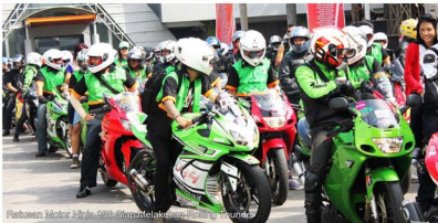
Pasukan Motor Ninja 250-SiKmermelakukan-Pulling-Brake