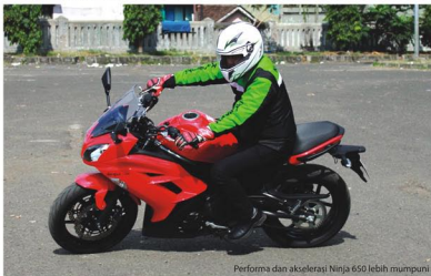
Performa dan akselerasi Ninja 650 lebih mumpuni

N inja 650 memang jelas semakin mampu mengokohkan image Kawasaki yang menyasar segmen di kelas premium Bike. Dengan menawarkan konsep motor bergaya touring , tentu dapur pacu yang dimuntahkannya pun lebih memiliki performa yang mumpuni di kelasnya. Nah guna merasakan seperti apa sih, akselerasi dan performa impresi berkendaraan dengan motor Ninja 650 ini ?? Yuk, mari simak bahasannya.