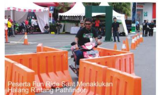
Peserta Fun Ride Saat Menaklukan Halang Rintang Pathfinder

Meski terik matahari terasa menyengat dirasa pengunjung. Hal itu tak mengurungkan pengunjung untuk terus setia mengikuti serangkaian acara yang digelar, seperti melihat lomba Slow Ride yakni lomba ketangkasan riders