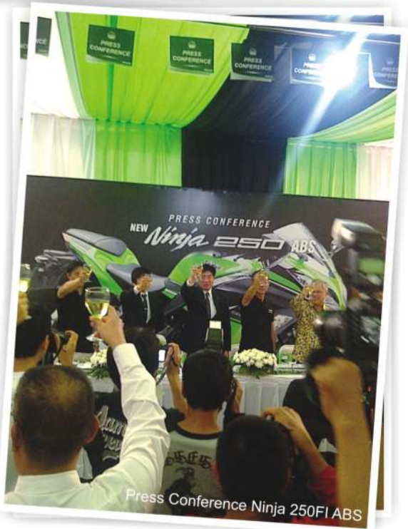
Press Conference Ninja 250FI ABS

New Ninja 250 ini memiliki 4 pilihan warna, yaitu Lime Green, Ebony Pearl, Stardust White dan Passion Red , dengan banderol harga Rp. 52 juta (OTR Jabar). Sementara New Ninja 250 yang dilengkapi ABS memiliki 2 warna pilihan yaitu Lime Green Ebony dan Passion Red – Stardust White yang dilepas dengan estimasi harga Rp. 59 juta (OTR Jabar) mantap bukan!!