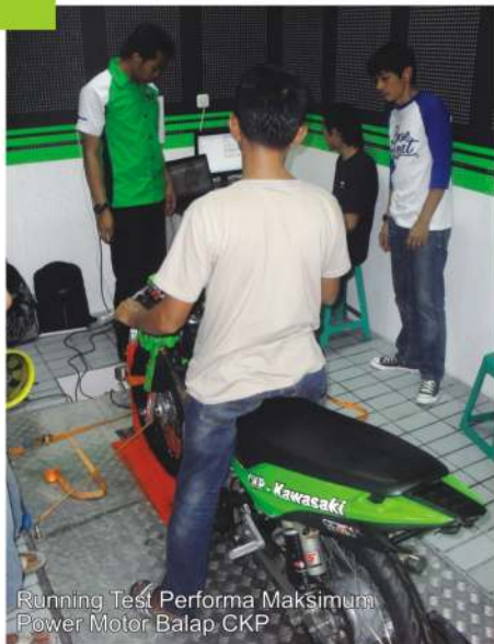
Running Test Performa Maksimum Power Motor Balap CKP

Sebagai salah satu bentuk dukungan, dalam hal pemenuhan pelayanan secara aftersales terhadap customers . Departemen Service Area PT. Citrakarya Pranata (PT. CKP) telah menyiapkan seperangkat piranti Dyno Test , sebagai salah satu piranti penunjang teknologi dan tuntutan standarisasi Agen Tunggal Pemegang Merek (ATPM) Kawasaki, sebagai salah satu pabrikan motor yang serius bermain di segmen motor premium bike.