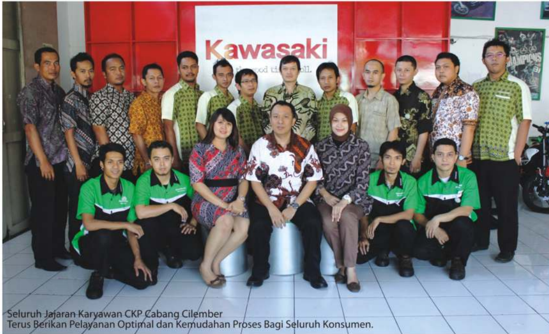
Seluruh Jajaran Karyawan CKP Cabang Cilember Terus Berikan Pelayanan Optimal dan Kemudahan Proses Bagi Seluruh Konsumen.

P T.Citrakarya Pranata (PT.CKP) selaku Main Dealer Kawasaki Area Jawa Barat, yang berpusat di Jl. Soekarno Hatta No.727, Bandung. Pastinya, memiliki juga cabang di beberapa lokasi. Salah satunya cabang PT. CKP yang berada di daerah Cilember-Cimahi, yakni CKP Cabang Cilember.