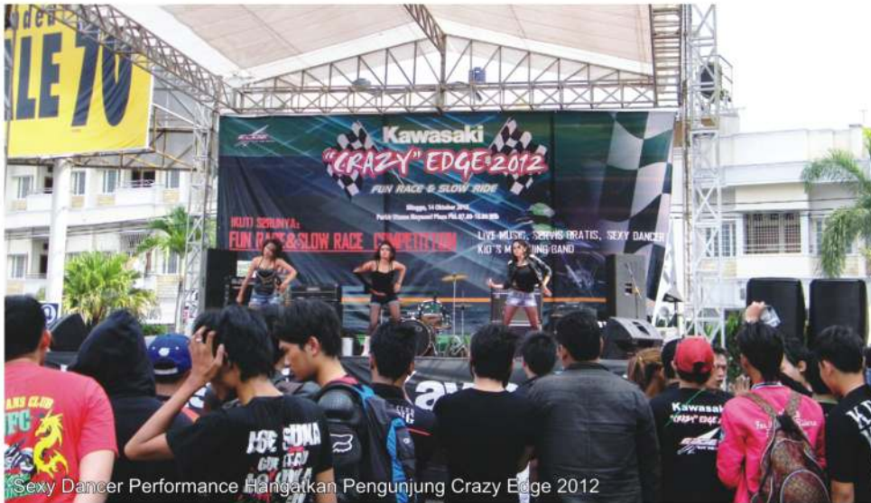
Sexy Dancer Performance Hangatkan Pengunjung Crazy Edge 2012