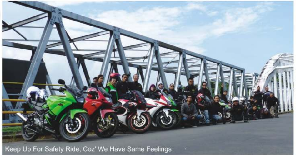
Keep Up For Safety Ride, Coz' We Have Same Feelings

Didalam bentuk keanggotaan klub, yang memiliki markas di Jalan Pasir Impun Atas No 5 Arcamanik - Bandung Telepon 085795010706 tersebut, ternyata membership nya di bagi menjadi 4 strata. Yakni, pertama Life Member , yang memiliki kredibilitas secara keanggotaannya, memiliki