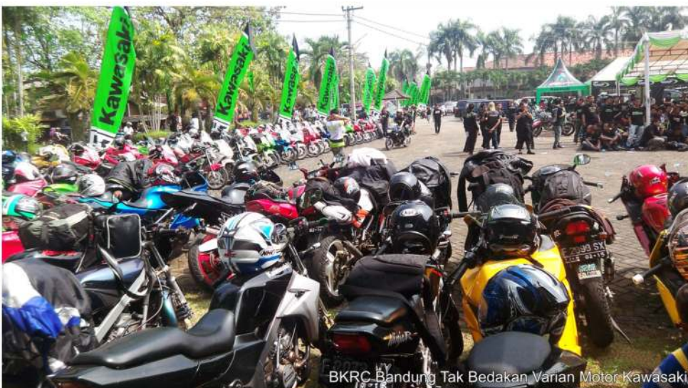
BKRC Bandung Tak Bedakan Varian Motor Kawasaki

Selain secara organisasinya terkoordinasi dengan baik, BKRC Bandung pun memiliki Koperasi Intern , dimana tujuannya mampu mengakomodir seluruh keperluan dan kebutuhan seluruh anggotanya. Nah , kegiatan dalam waktu dekat, tepatnya tanggal 17-18 November 2012 nanti. Klub BKRC Bandung ini, akan mengadakan Touring dalam rangka menghadiri 7 th anniversary BKRC Purwokerto sekaligus Family Gathering di kawasan Batu Raden Purwokerto. Wah, mantab..Keep Safety Riding saja Bro...!!