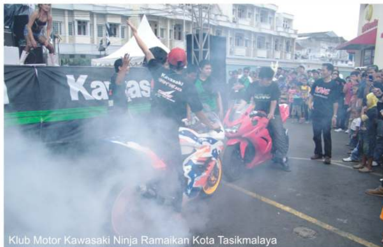
Klub Motor Kawasaki Ninja Ramaikan Kota Tasikmalaya

Antusiasme memang jelas dirasakan oleh seluruh pengunjung dan warga Tasikmalaya. Itu terlihat disaat euphoria seluruh pengunjung bersorak riang dan memenuhi pelataran area Parkir Mayasari Plaza, Tasikmalaya. Berikut, tak luput dihadiri juga oleh tiga klub besar Kawasaki Ninja, seperti Kawasaki Ninja Club (KNC), Ninja Owners Tasikmalaya (NOT) dan Ninja Fans Club (NFC).