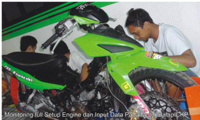
Monitoring full Setup Engine dan Input Data Pada Motor Balap CKP

Selain itu, adanya Dyno test ini dirasakan pihaknya memang sangat cukup membantu tim balap Kawasaki CKP Titan Speed Racing Team dalam hal riset performa motor balapnya, sekaligus melakukan input data secara akurat dan setup engine secara keseluruhan. Memang membantu sekali!!