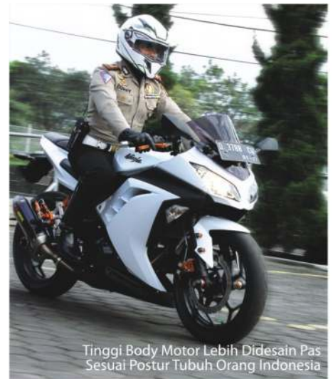
Tinggi Body Motor Lebih Didesain Pas Sesuai Postur Tubuh Orang Indonesia

"Saat bermanuver di posisi tikungan pun, saya merasakan traksi kemudi dirasa lebih seimbang, dan cengkraman ban pun, saat menajal aspal hitam terasa lebih ringan dan stabil. Meski disaat saya besut, pada kondisi jalanan kering maupun basah, tetap saja manuver yang dihasilkannya pun tetap tak bergeming dan lebih stabil". Tutup Ayah tiga Anak tersebut mantap. Penasaran Kan!!