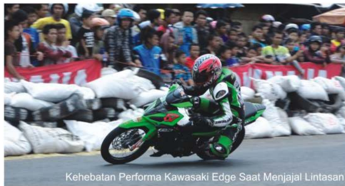
Kehebatan Performa Kawasaki Edge Saat Menjajal Lintasan

Kawasaki CKP Titan Speed Racing Team mengatakan, bahwa dengan total raihan sebanyak 306 poin, berikut mengoleksi selisih poin 97 di seri empat tersebut. Maka timnya semakin memantapkan standing point di urutan posisi Kejurda Jabar. Dengan begitu, secara perolehan poin, timnya pun dipastikan menjadi juara umum Kejurda Jabar 2012, sekaligus menjadi jawara dua kali berturut-turut di ajang Kejurda Jabar tersebut. Bravo Kawasaki CKP Titan Speed Racing Team..