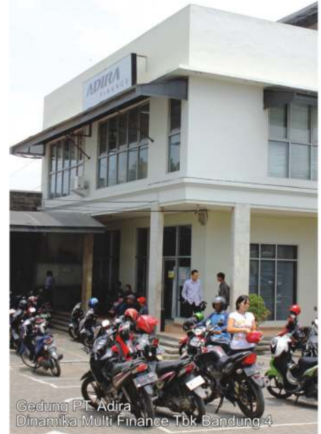
Gedung PT. Adira Dinamika Multi Finance Tbk Bandung 4

Bicara mengenai torehan penjualan motor dengan pihak Kawasaki, khususnya kontribusi Dealer PT. CKP Cabang Cilember dan Tiara Motor Cimahi. Secara market share Adira Finance bandung 4, menorehkan kurang lebih 40% dibanding Perusahaan Pembiayaan lain.