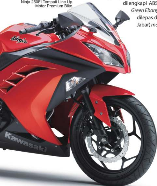
Ninja 250FI Tempati Line Up Motor Premium Bike