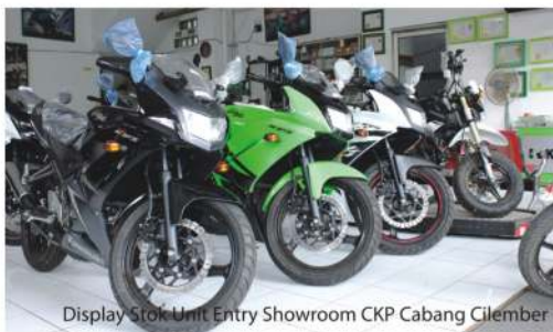
Display Stok Unit Entry Showroom CKP Cabang Cilember

terus bersaing dan bermain dalam meningkatkan progresifitas penjualannya secara optimal.