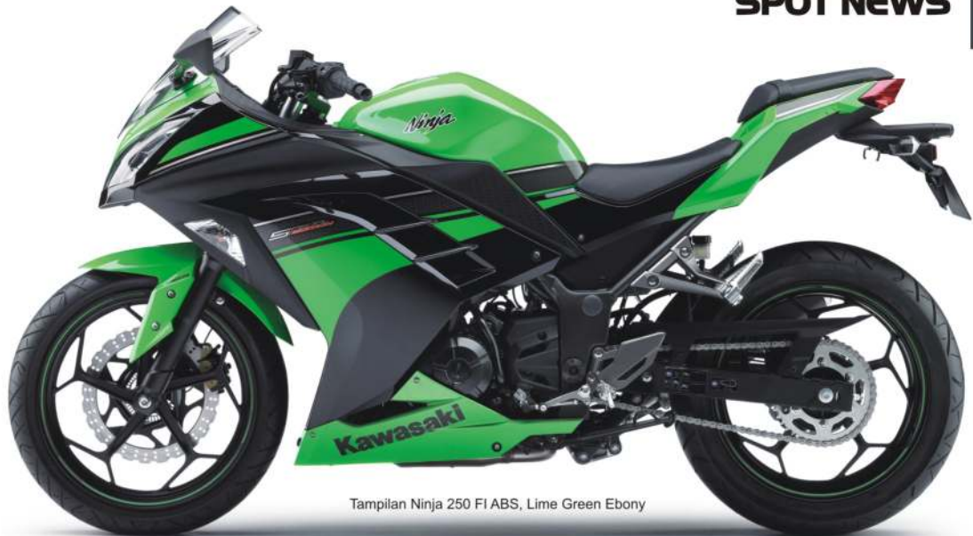
Tampilan Ninja 250 FI ABS, Lime Green Ebony

Pengembangan motor baru New Ninja 250 tersebut, diriset pihaknya secara konsisten hampir dua tahun untuk mengevaluasi segala sisi, agar tetap sukses dan mampu bermain di pasar Indonesia dan negara-negara lainnya. New Ninja 250 yang mengusung mesin Injeksi ini, tampil dengan bentuk body keseluruhan yang mantap dan lebih lebar pada bagian fairing -nya. Sedang, New Ninja 250-FI yang dilengkapi dengan piranti ABS, jelas mampu memberikan keamanan ekstra bagi pengendaranya pada saat melakukan pengereman.