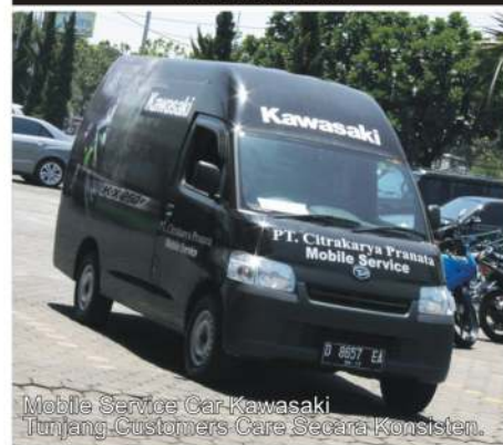
Mobile Service Car Kawasaki Tunjang Customers Care Secara Konsisten.

UNTUK INFORMASI SEPUTAR MOBILE SERVICE CAR KAWASAKI SILAHKAN ANDA HUBUNGI CALL CENTER KAMI DI 0812-23-4141-23