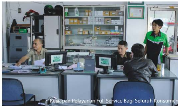
Kesiapan Pelayanan Full Service Bagi Seluruh Konsumen

Bermula dan berdiri tanggal 15 Juli 2004, sebagai salah satu cabang ketiga yang berada di bilangan Jalan Raya Cilember No. 264 A, Cimahi. CKP Cabang Cilember sampai saat ini, Secara konsisten dipastikan mampu