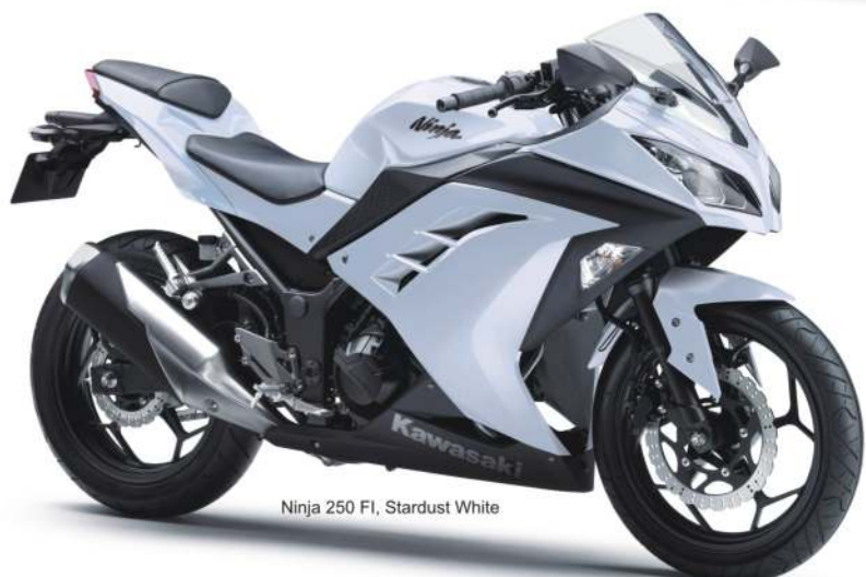
Ninja 250 FI, Stardust White