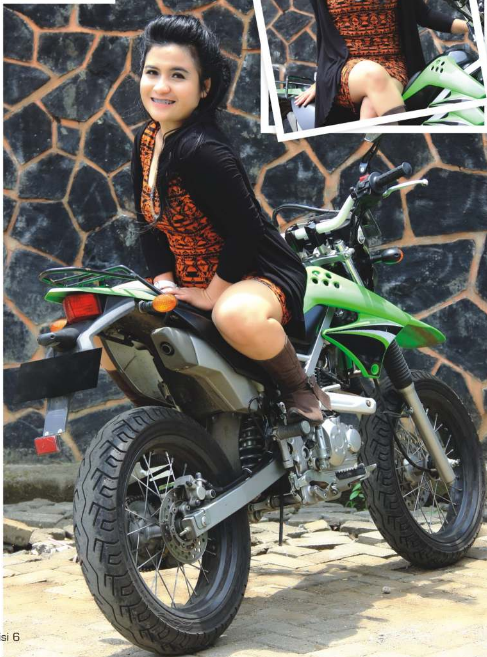
Model : Ita - Naskah : Ramdan - Foto : Dian Aconk - Properti : Kawasaki KLX by Mulky