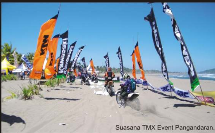
Suasana TMX Event Pangandaran.

U sai sudah gelaran event tahunan bertajuk Trabas Merdeka X (TMX) - The Legend Goes To a Decade , pada (31/08-01/09) lalu. Dimulai journey start dari Lapangan Upakarti, Soreang - Bandung, melewati Cipatujah, Sampai finish menuju Pangandaran.