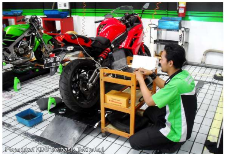
Perangkat KDS Berbasis Teknologi

"Pastinya software ini lebih memudahkan mekanik dalam mendeteksi permasalahan secara elektrik. kemudian sebagai penunjang perangkat special tools terkini, tentunya dengan adanya perangkat tersebut, jelas