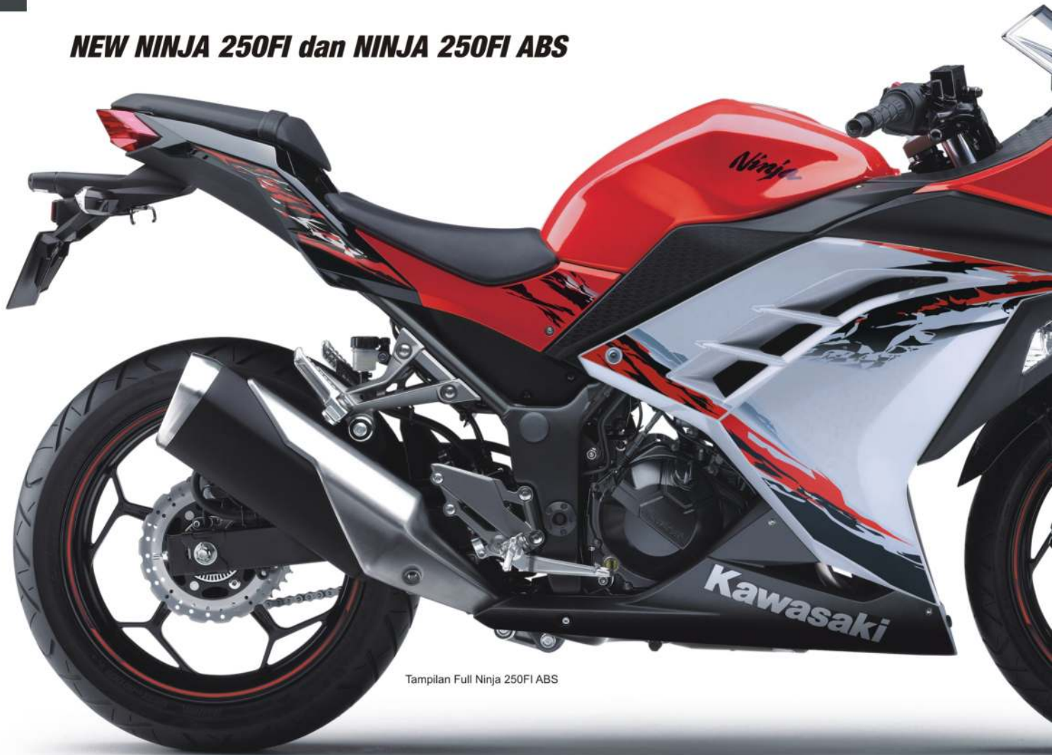
Tampilan Full Ninja 250FI ABS