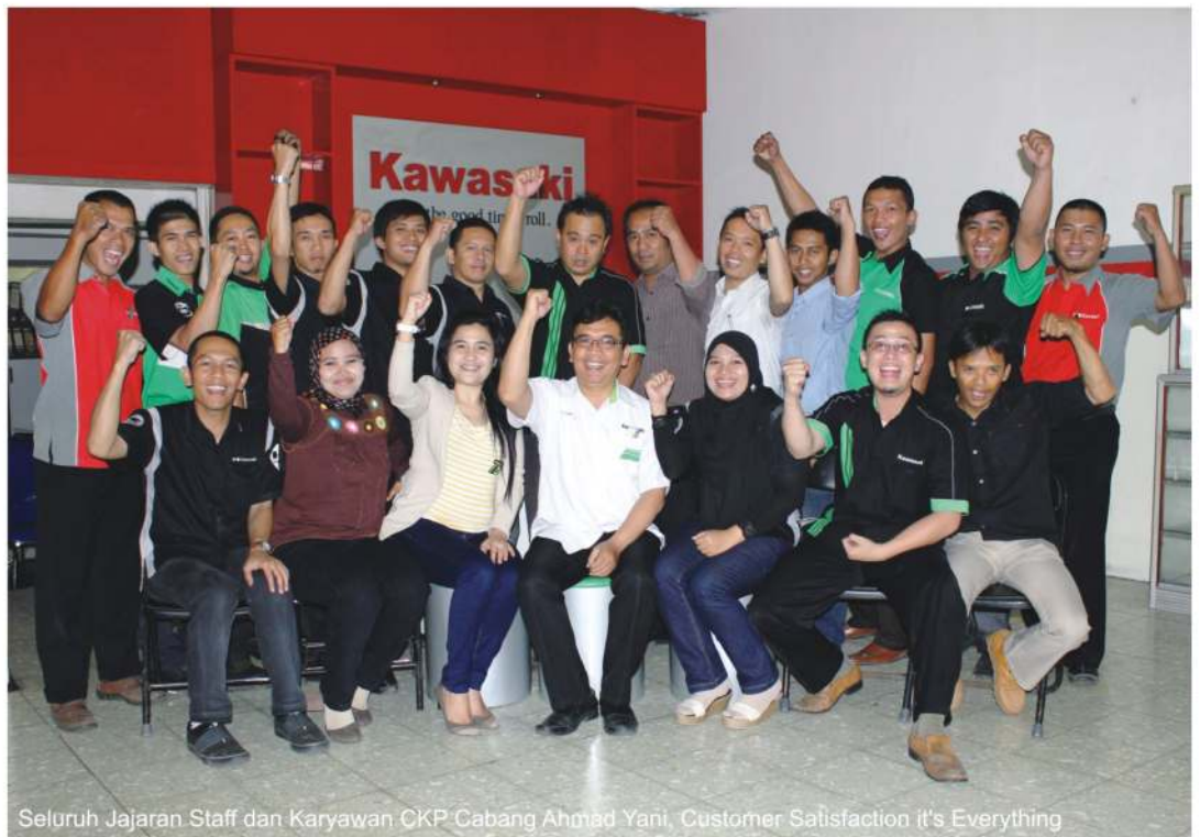
Seluruh Jajaran Staff dan Karyawan CKP Cabang Ahmad Yani, Customer Satisfaction it's Everything

awal tahun 2013 Kawasaki CKP Cabang Ahmad Yani diberi kepercayaan untuk menempati gedung baru yang lebih representatif, serta disupport fasilitas dan teknologi seperti kelengkapan toolkits mekanik