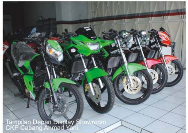
Tampilan Depan Display Showroom CKP Cabang Ahmad Yani.

Dalam hal keunggulan pelayanan secara optimal kepada customers . Cabang yang buka dari Senin-jumat mulai pukul 08.00- 17.00, dan Sabtu 08.00-14.30 WIB ini, melayani seluruh proses pengajuan secara cepat dan memuaskan kepada konsumen, serta terus melakukan improve pelayanan optimal dari segi aftersales dalam hal kepuasan kepada customers bengkelnya.