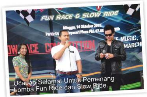
Ucapan Selamat Untuk Pemenang Lomba Fun Ride dan Slow Ride.

memperkenalkan lagi promo seluruh line up produk motor Premium Bike Kawasaki dan promosi Dealer terdekat, dalam hal ini Dealer Pratama Motor, Tasikmalaya.